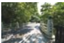
■大手橋 慶長元年(1596)に架けられた橋。徳川初代藩主頼房が築してから、大手橋と称されました。