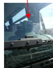
衝突被害軽減ブレーキ（ミリ波レーダー）