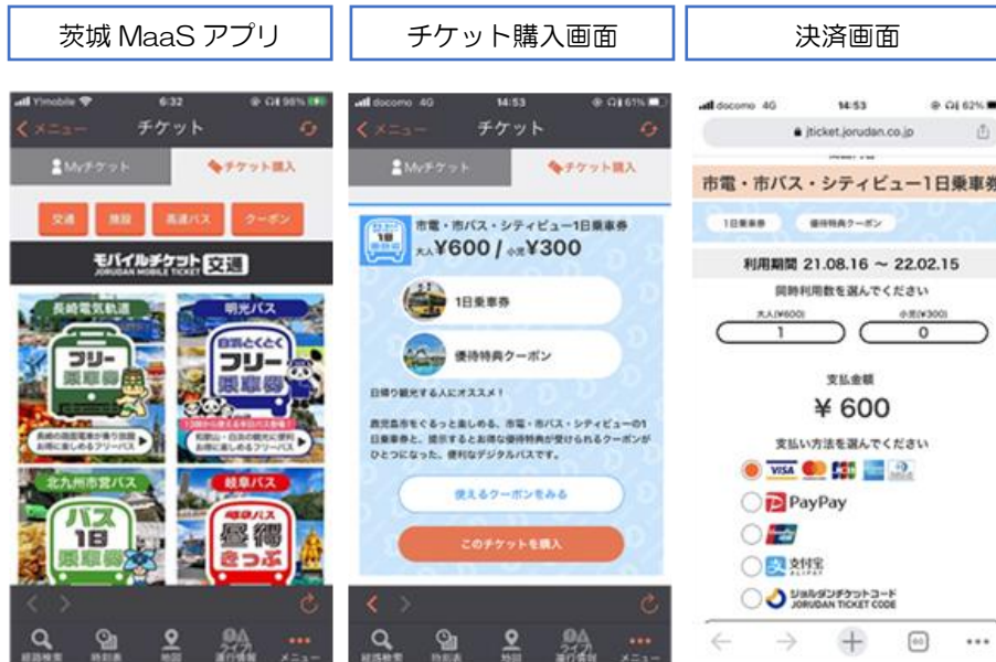
図. ジョルダン社の乗換検索アプリの購入・利用画面