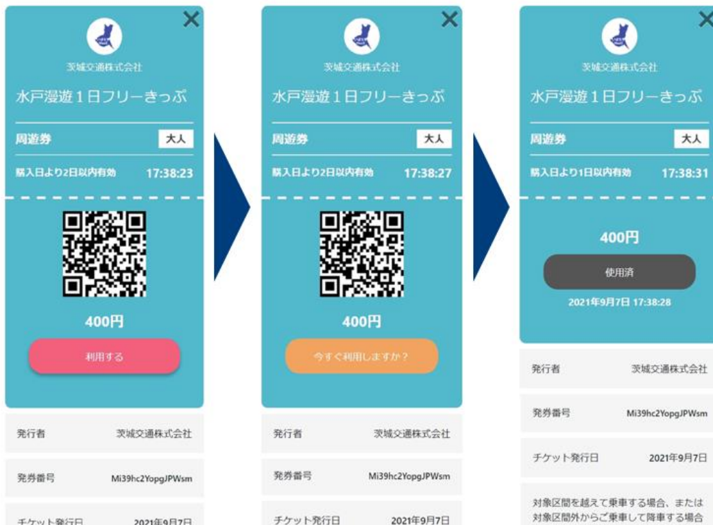
図. デジタルチケットの利用画面

購入したチケットはスマートフォン上で発行され、窓口などでの引き換え不要で、チケット操作をして画面を見せるだけでバスや鉄道にご乗車頂け、コロナ禍において安心してご利用頂けます。