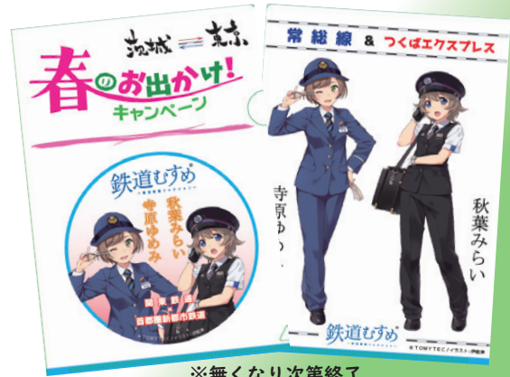
※無くなり次第終了

期間中に左記載のおトクな乗車券をご購入のお客様にもれなく「鉄道おすすめミニクリアファイル」をプレゼント!