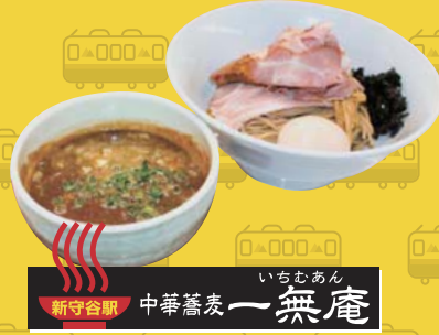
新守谷駅 中華蕎麦 いちむあん 一無庵