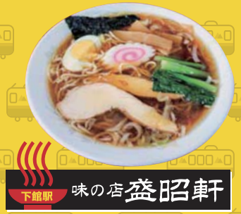
下館駅 味の店 益昭軒

ラーメンスタンプラリーに、たいへん便利！ 常総線1日フリーきっぷ ※ご好評につき親子割引実施中！