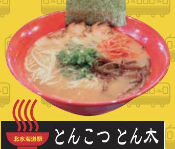
北水海道駅 とんこつとん太