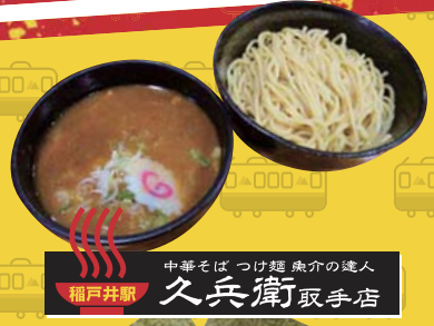
稲戸井駅 中華そば つけ麺 疾介の達人 久兵衛 取手店