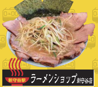
新守谷駅 ラーメンショップ 新守谷店