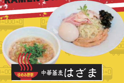
ゆめみ野駅 中華蕎麦 はざま