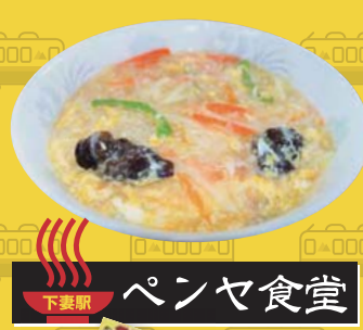
下妻駅 ペンヤ食堂