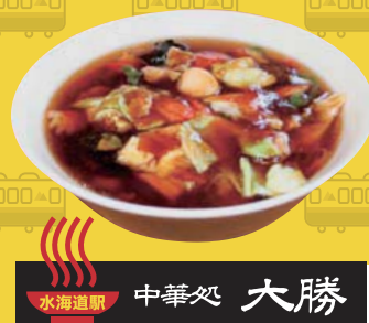
水海道駅 中華処 大勝