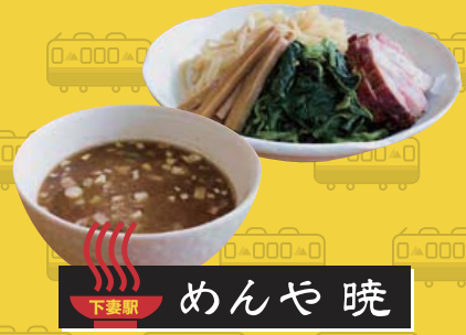
下妻駅 めんや 暁