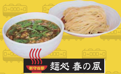
新守谷駅 麵処 春の風